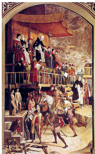
Auto de Fe (Berruguete)

En el terreno religioso, potenció el papel de la Inquisición, que perseguía cualquier desviación religiosa y que intentó evitar la entrada de ideas protestantes en España. Su objetivo era defender la ortodoxia religiosa. Para ello, dictó leyes para prohibir libros (su importación), los listados de libros prohibidos eran controlados por la Inquisición; prohibió salir al extranjero a estudiar en otras universidades; llevó a cabo una política de persecución de judíos y moriscos, sospechosos de herejía, que eran obligados a declarar en los autos fe organizados por la Inquisición; y limpieza de sangre, es decir, impide ostentar cargos públicos a descendientes de judíos y musulmanes.